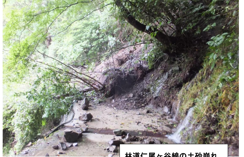
林道仁尾ヶ谷線の土砂崩れ