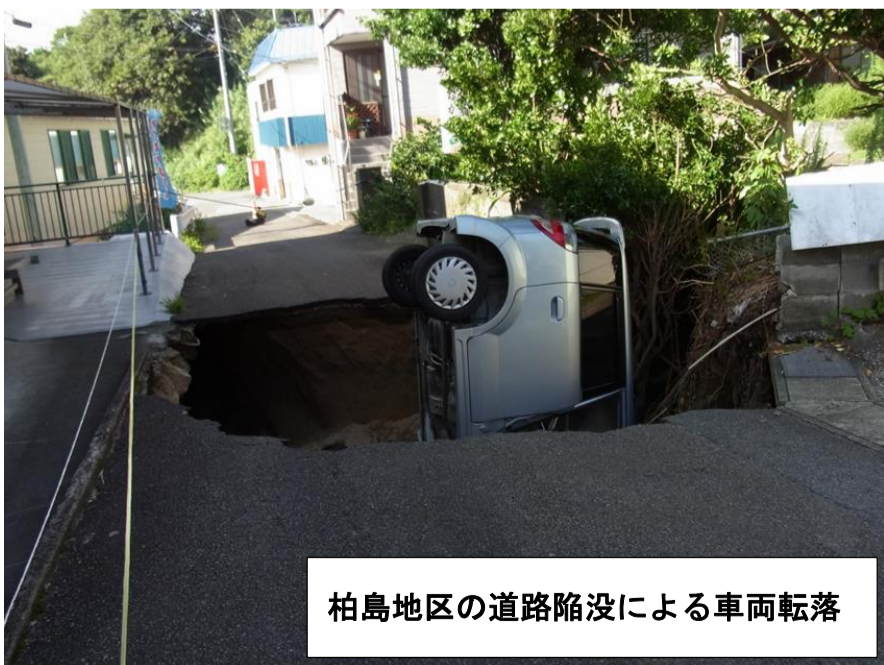
柏島地区の道路陥没による車両転落