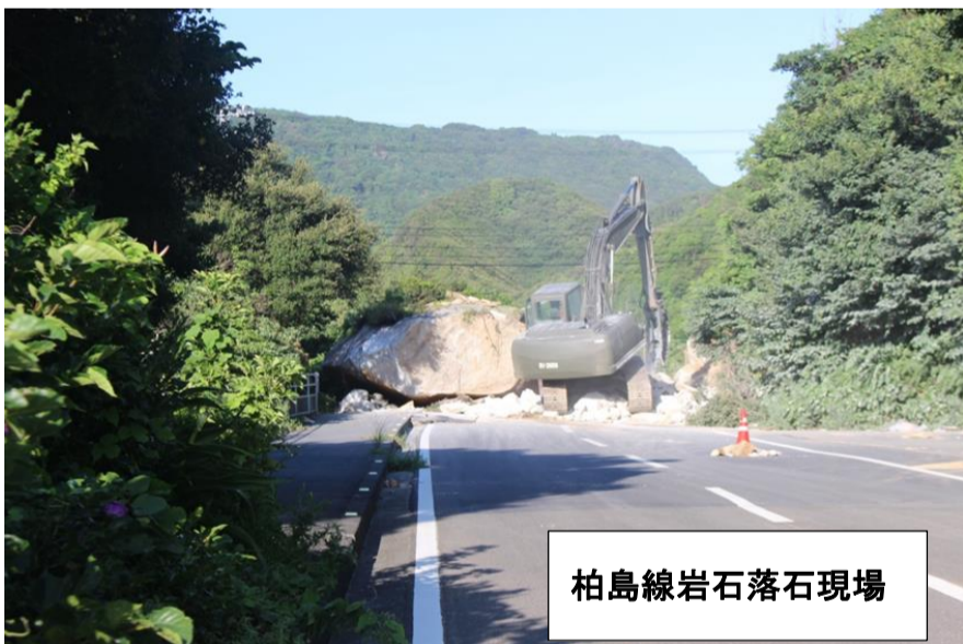
柏島線岩石落石現場