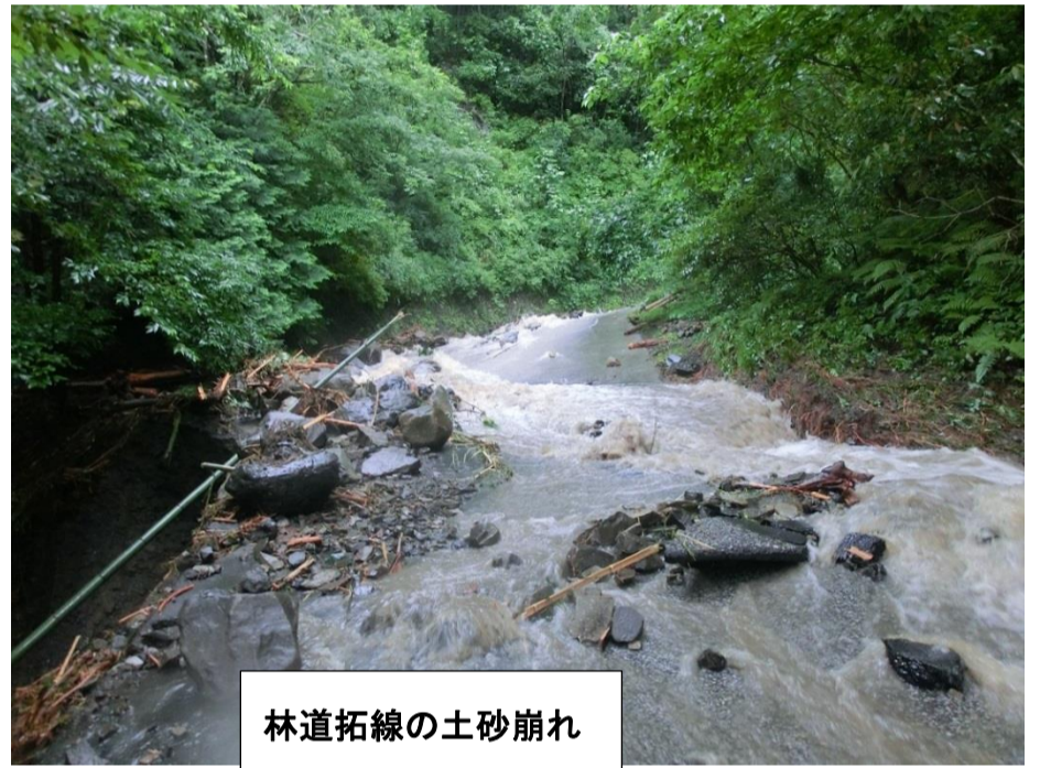
林道拓線の土砂崩れ