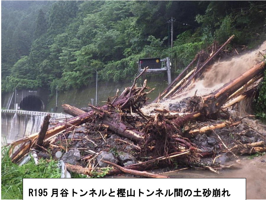
R195 月谷トンネルと檜山トンネル間の土砂崩れ