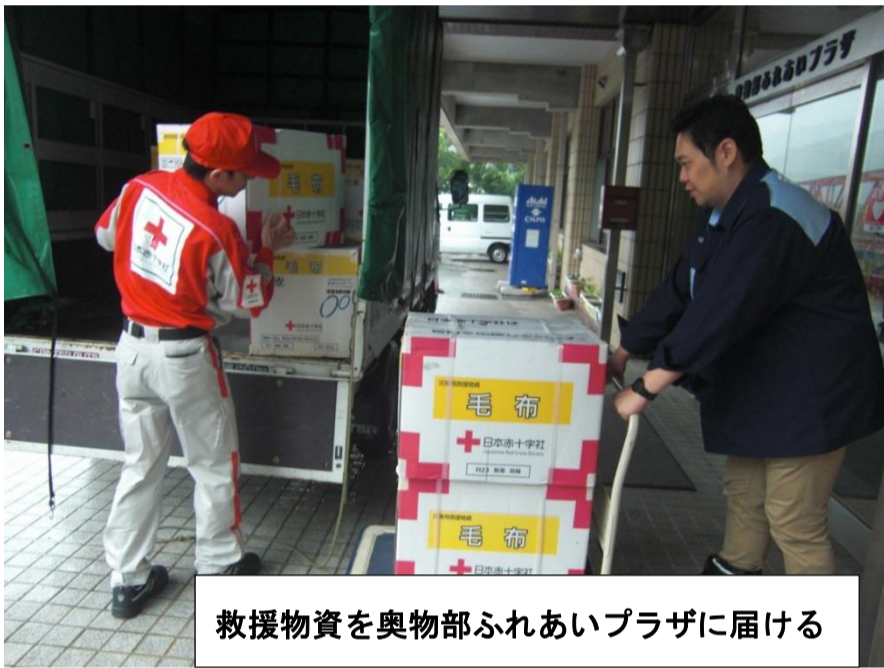
救援物資を奥物部ふれあいプラザに届ける