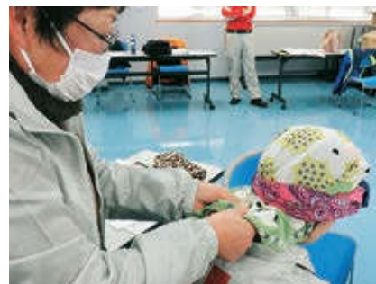
「身近なものを使った応急手当」

けがに備え、身近なものを使った応急手当の講習会など、みなさまの地域で講習ができます。ご相談ください！