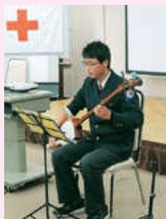
三味線でのなつかしい曲の演奏には、会場からも自然と手拍子が起こりました。