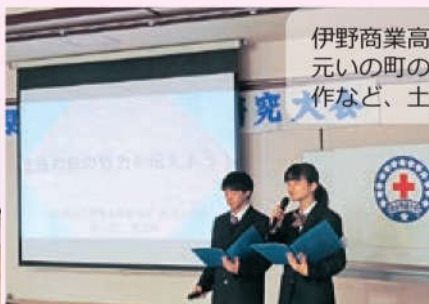
伊野商業高校の学生さんの発表の様子、地元いの町の土佐和紙を活用した工芸品の製作など、土佐和紙愛の伝わる発表でした。